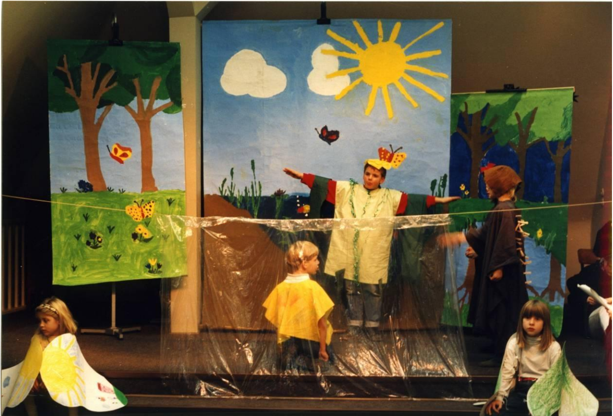
Die kleine Igelin spricht mit dem Fisch