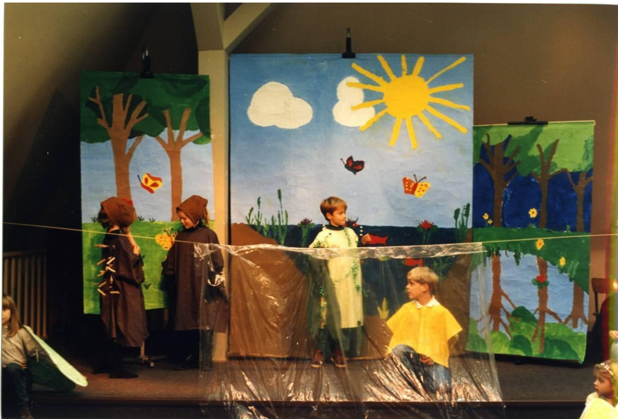
Die kleine Igelin und der kleine Igel begrüßen sich