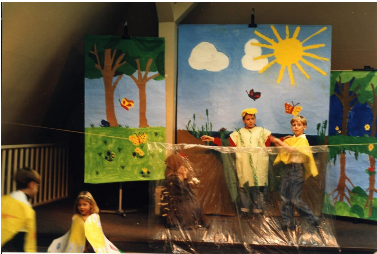
Die kleinen Igel tauchen unter