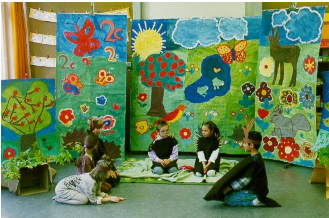
Abbildung 4: Der kleine Igel und die kleine Igelin unterhalten sich mit den Rehen