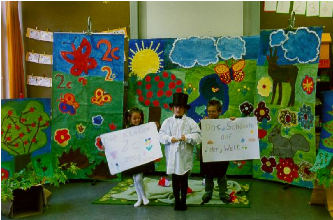
Abbildung 1: Der Erzähler, der kleine Igel und die kleine Igelin