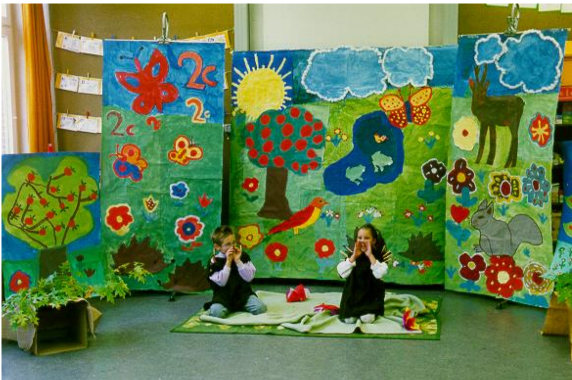
Abbildung 2: Der kleine Igel und die kleine Igelin rufen die Rehe