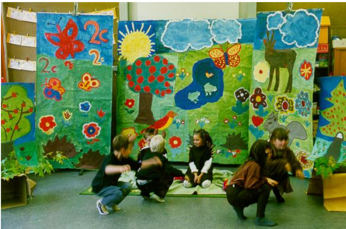
Abbildung 6: Die Eichhörnchen verlassen die Bühne