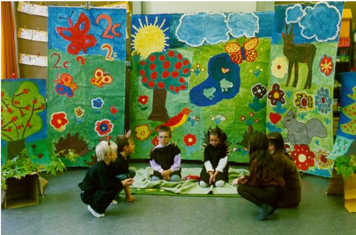
Abbildung 5: Die kleine Igelin und der kleine Igel sprechen mit den Eichhörnchen