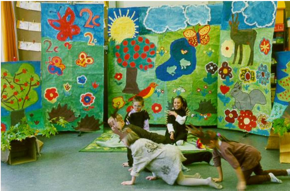
Abbildung 3: Die Rehe treten auf